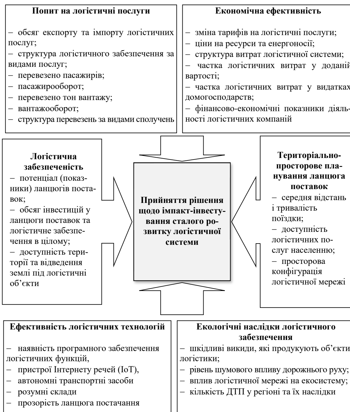
Рис. 2. Критерії прийняття рішення щодо імпакт-інвестування сталого розвитку логістичної системи