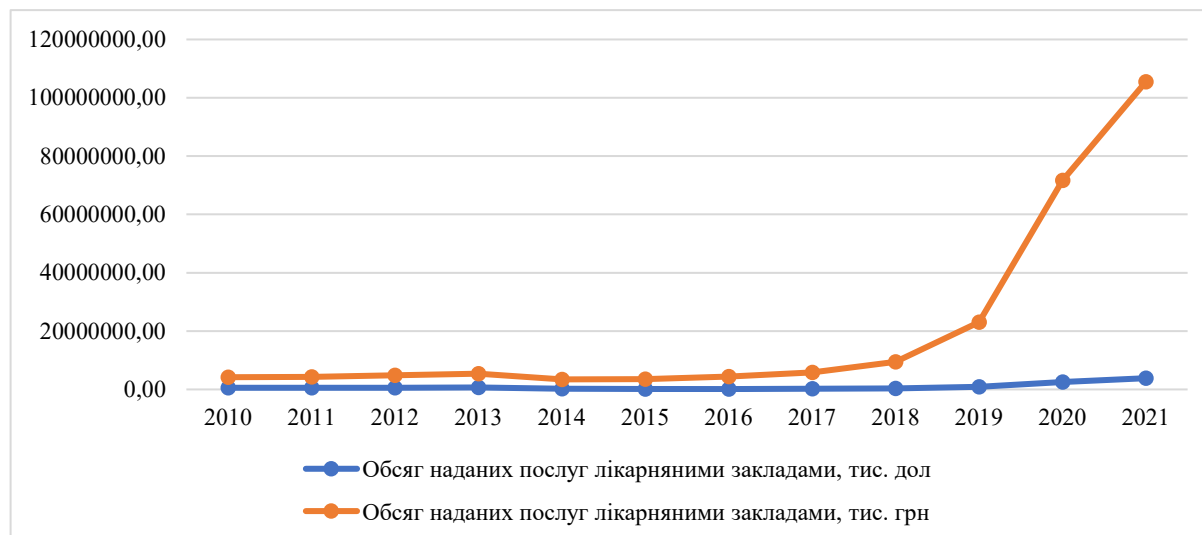
Рис. 2 Графічне відображення обсягу наданих послуг лікарняними закладами сфери охорони здоров'я України у 2010-2021 рр.

Джерело: складено за даними Державної Служби статистики України