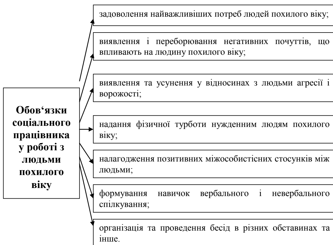
Рис. 2 Обов'язки соціального працівника

Нами розглянуто обов'язки соціального працівника при роботі з людьми похилого віку [11] (див. рис.2).