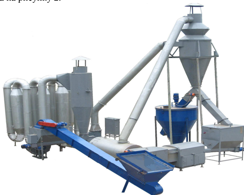
Рис. 2. Аерофонтанна сушильна установка.

Такий спосіб сушіння можна реалізувати на сушильній установці, принципова схема якої зображена на рисунку 2.