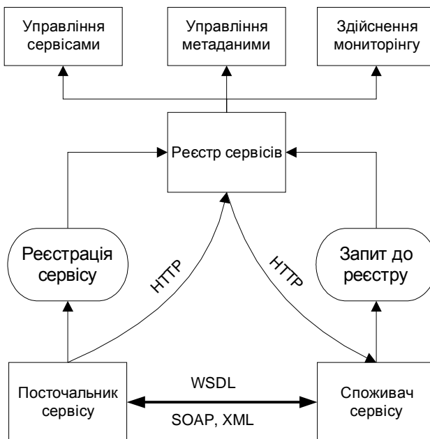
Рис. 1. Загальна схема сервісно-орієнтованої архітектури інтеграційної платформи у сфері надання транспортних послуг

Архітектура SOA використовується для скорочення витрат, оскільки під час створення цієї архітектури користувалися такими принципами [3]: