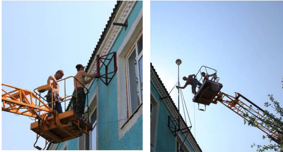
Рис. 2. Монтування конструкції опори

касу, який прикріплений до стіни будівлі 4-ма наскрізними анкерними болтами.